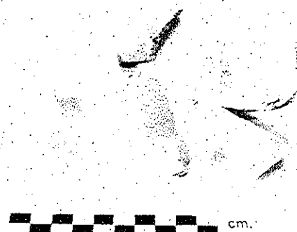
Ejemplares del Tipo Palmar-Danta Naranja Policromo

Zoila Yolanda Calderón Santizo Zoila Yolanda Calderón Santizo